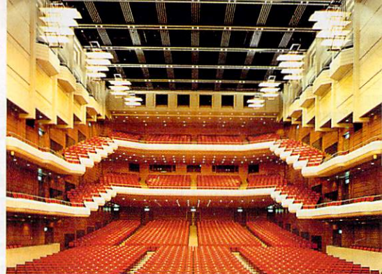
◎3 層になったホール内部