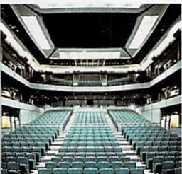
◎ グリーン系の座席で落ち着いた印象

■客席数 747席(うち車椅子用4席) ■主な付帯設備 オーケストラピット、オープンコントロールブース、舞台点吊り装置、客席点吊り装置、ピアノ、音響調整卓、映写機、他