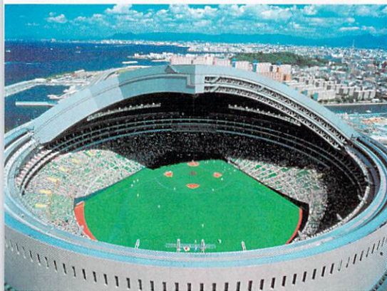
◎ホークスタウンの中核施設となっている

☎☎☎☎☎☎☎☎ ■その他 バックステージア (10~16時・1時間毎出発/大人1000円、4歳~中学生500円) RT福岡ソフトバンクホークスファンクラブ (会報・来場特典などあり)