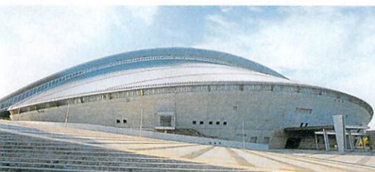
宮城県総合運動公園の中央に位置する

宮城県のスポーツ・レクリエーションの拠点として整備され、2001年には「新世紀・みやぎ国体」のメイン会場になった宮城県総合運動公園のメインアリーナ。敷地内には、他にスタジアム、総合プール、テニスコート、フットサルコートなどが併設されている。大規模なスポーツ大会から一般民のレクリエーション、また音楽コンサートなど幅広いイベントに対応している。