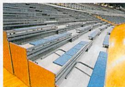
壁面収納式の可動席