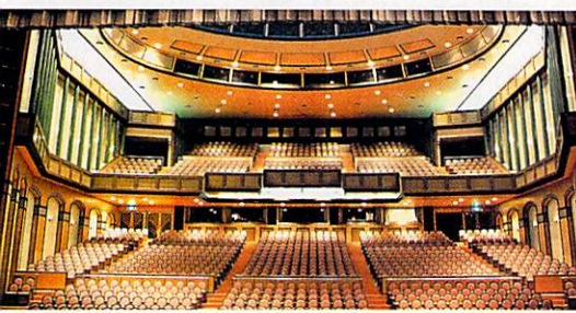
2階式のバルコニーが美しい大ホール

緑と坂の町、神奈川県座間市に市民の芸術文化活動を通じて、ハーモニーの心を育み、広げる交流の場として誕生した「ハーモニーホール座間」。人間性と芸術性の調和を目指しており、市民の積極的な利用を大いに期待している。大ホールは「森」を小ホールは「水」をテーマに内装を整え、共通ロビーは「夕暮れの公園」をイメージして造られている。