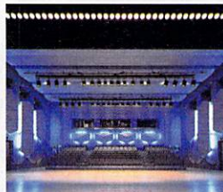
小ホールは舞台に合わせた可動席

■特色 「水のホール」と名づけられた小ホールは、床が可変式になっており、5パターンの舞台、客席を採用できる。ファッションショー、ダンスパーティ、ピアノやバイオリンの発表会、映画試写会など多目的に利用可能なスペースだ。ハワイエは、深海を思わせる落ち着いたムードを作り出すのに役立っている。