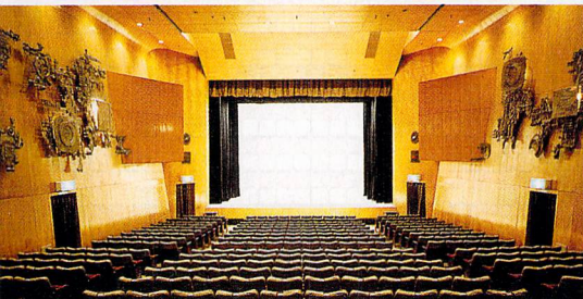
◎2002年に舞台・音響・照明の改修を行った

■特色 1960年代後半に「怒りをこめて振りかえれ」の上演で超満員を記録、1976年には「つかこうへい劇団」、野田秀樹の「夢の遊眠社」、「第三舞台」が公演し、若者が長蛇の列を作る劇場になっている。また、創設以来続く「紀伊國屋寄席」は定期的な催しものとして現在も安定した人気を得ている。