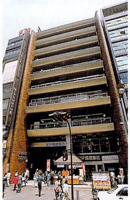
◎新宿のにぎわいを見続けて40年以上