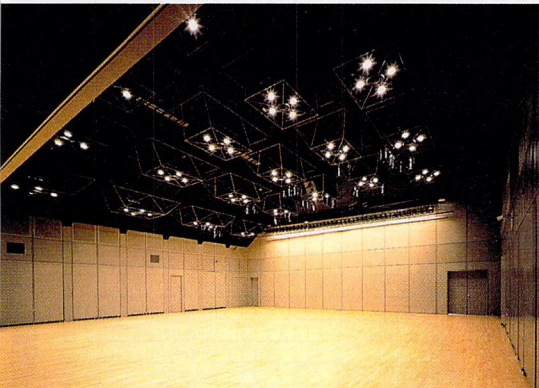
② 長方形の箱状のホール

< Quest For The New Standard >がこのホールのモットー。ファッションの街原宿表参道にあって、流行に流されることなく、ベーシックで、かつ洗練された世界を表現するホールとして存在している。様々なイベントに対応する機能を有した多目的ホールとして利用頻度が高い。