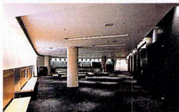
④ ホール正面のホワイエ部分