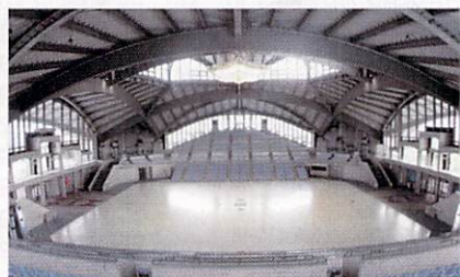
◎ 使いやすさを追求した展示場