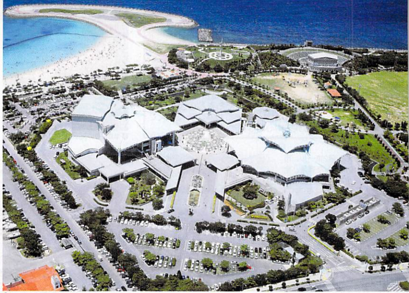
◎ 亜熱帯の自然に囲まれた大規模施設