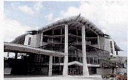
◎ 印象的な外観を持つ劇場棟

■ 客席数 1841人(固定席1709席) ■ 主な付帯設備 オーケストラピット、音響・照明装置、オペラカーテン、スクリーン装置、小迫り、他