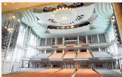
◎ 天井が高く開放感あふれる空間