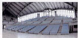
◎ 多彩な用途に対応

■ 客席数 最大収容人数約5000人(アリーナ面仮設客席2860席、可動席672席、2階客席1468席) ■ 主な付帯設備 天井吊物装置、仮設ステージ、音響・調光調整卓、電動ロールブラインド、電源・給排水設備(床ピット)、他