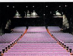
常に話題の芝居が上演されている