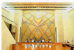
開演前1時間設けられるホワイエのバー

■ACCESS 東京メトロ銀座線京橋駅2番出口より徒歩1分 東京メトロ有楽町線銀座一丁目駅7番出口より徒歩約1分 ■駐車場 なし ■URL http://www.theatres.co.jp/letheatre/ ■待ち合わせスポット ビル1Fフラワーショップ……首都高速高架下そば。銀座通り沿い