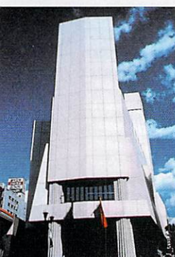
銀座の顔となっているル テアトル銀座